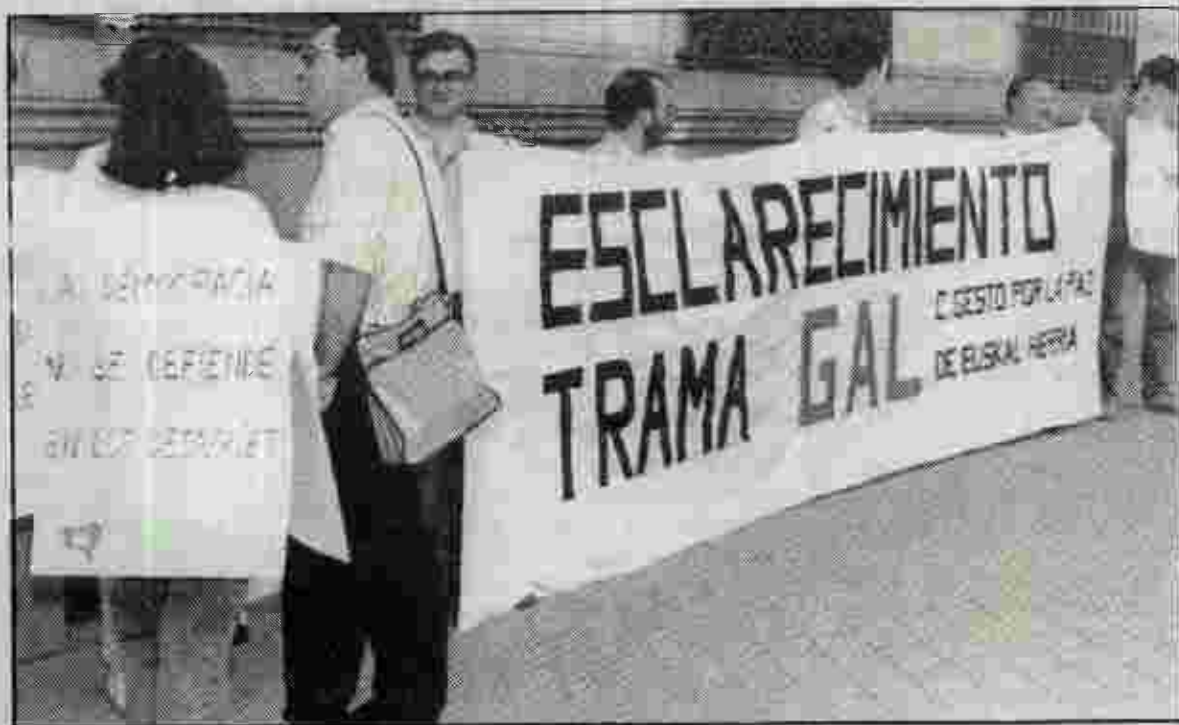
Miembros de Gesto por la Paz, concentrados con pancartas ante la sede de la Audiencia Nacional.

Por otro lado, el documento recoge que una persona de apellido Frugoli se registró en el hotel Orly de San Sebastián dos días antes de que se cometiera en Bayona un atentado contra el bar Monbar , en el que murieron cuatro personas. Frugoli, según la Ertzaintza, ocupó dos habitaciones para tres personas. El 26 de septiembre, un día