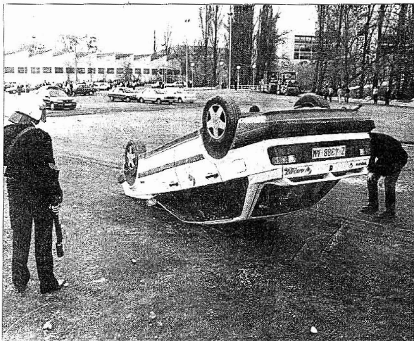
El coche volcado sufrió daños en las lunas y en el techo.