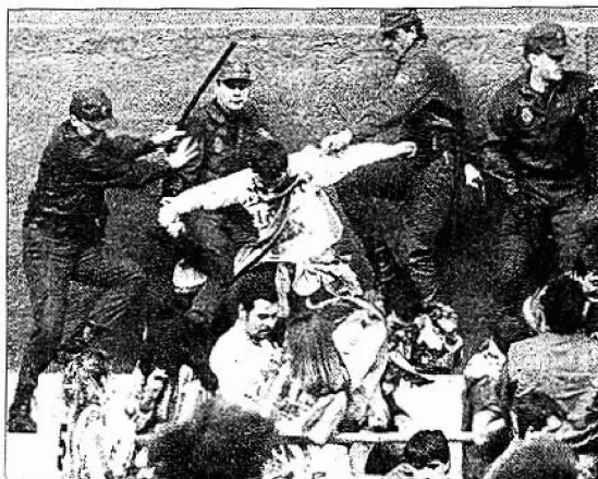
La policía actuó para evitar enfrentamientos entre las dos aficiones.

Al parecer el coche fue volcado en el transcurso de unos pequeños incidentes ocurridos inmediatamente después del partido. En las cercanías del estadio, un grupo de jóvenes recogía piedras, presumiblemente para lanzarlas contra los autobuses en los que iban a viajar los seguidores del Atlético de Madrid. La policía apareció en el lugar para disolver al grupo, aunque no