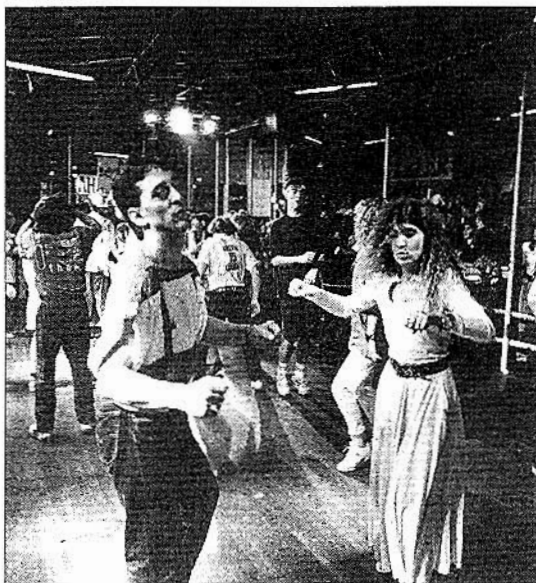
El Gobierno Vasco controlará el horario de las discotecas. A. SOZ

Las faltas muy graves tendrán multa de hasta 25 millones. Son básicamente las graves siempre