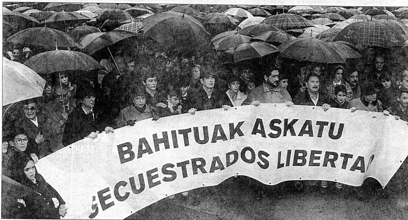
Manifestantes sujetan la pancarta con el lema de la movilización en la Plaza de la Estación, en Las Arenas, minutos antes de finalizar el acto.