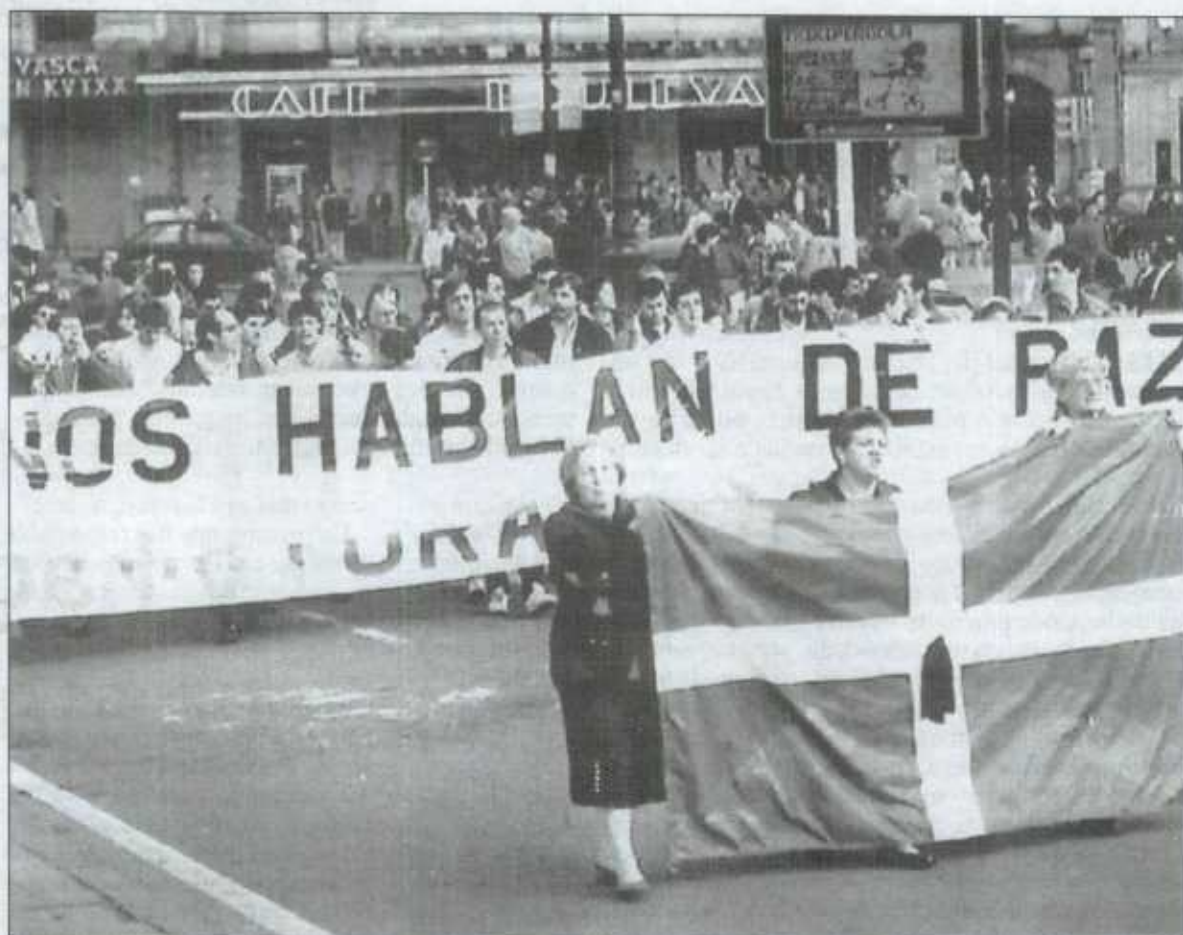
La manifestación de Bilbao estuvo encabezada por una pancarta con el lema «Nos hablan de paz, pero torturan y asesinan».

En Vitoria, varios centenares de personas se manifestaron anoche por las calles de la capital alavesa convocadas por las Gestoras Pro-