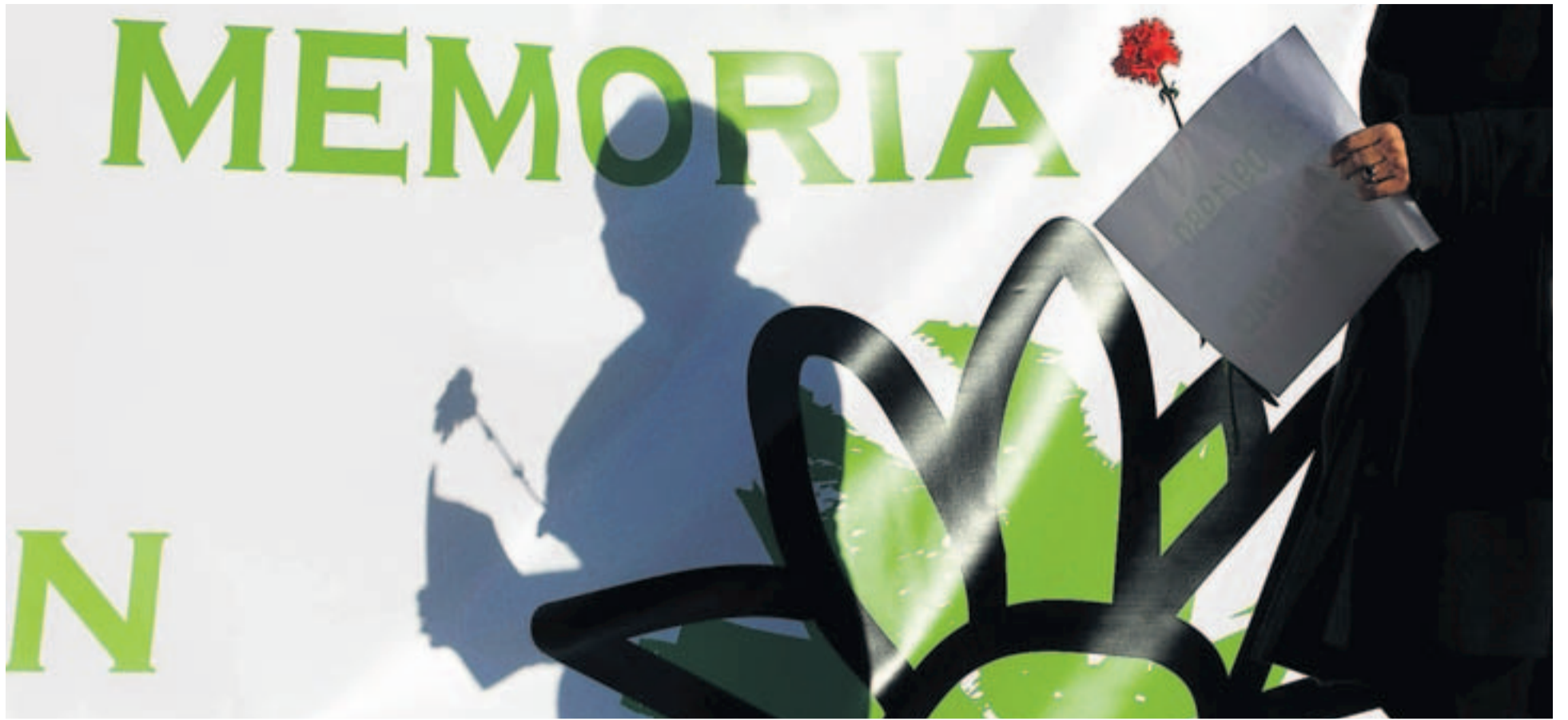
Familiares y representantes de Gesto depositaron claveles y carteles con los nombres de los asesinados junto a la pancarta de la concentración, ayer, en Bilbao.