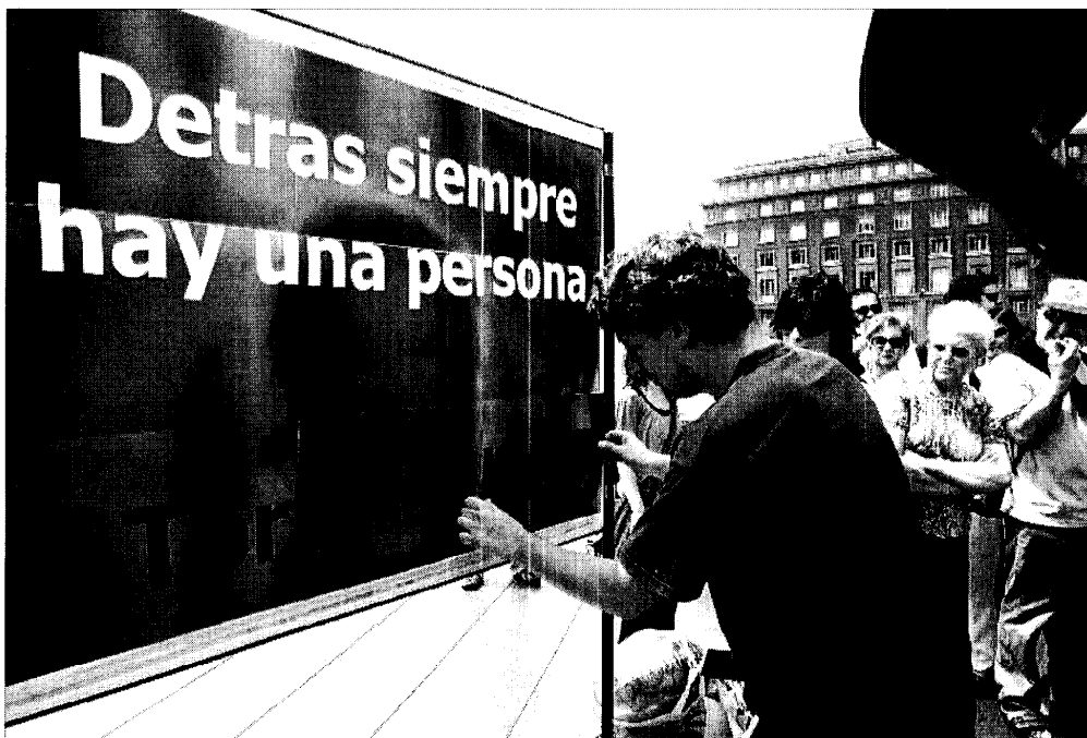
Un momento del acto contra la tortura celebrado ayer por Gesto por la Paz en el centro de Bilbao.