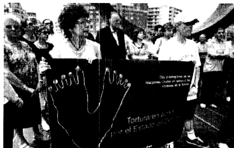
ACTO. Gesto realizó una concentración en Bilbao.

«Estaremos vigilantes ante cualquier irregularidad», advirtió ayer la secretaria de Política Autónoma del PP, Soraya Sáenz. El mismo Manuel Fraga alentó las sospechas al denunciar el jueves «que algo no funcionaba» en la llegada de votos de la colonia asentada en Venezuela. La vicepresidenta, María Teresa Fernández de la Vega, aseguró que la recepción funciona «sin problemas».