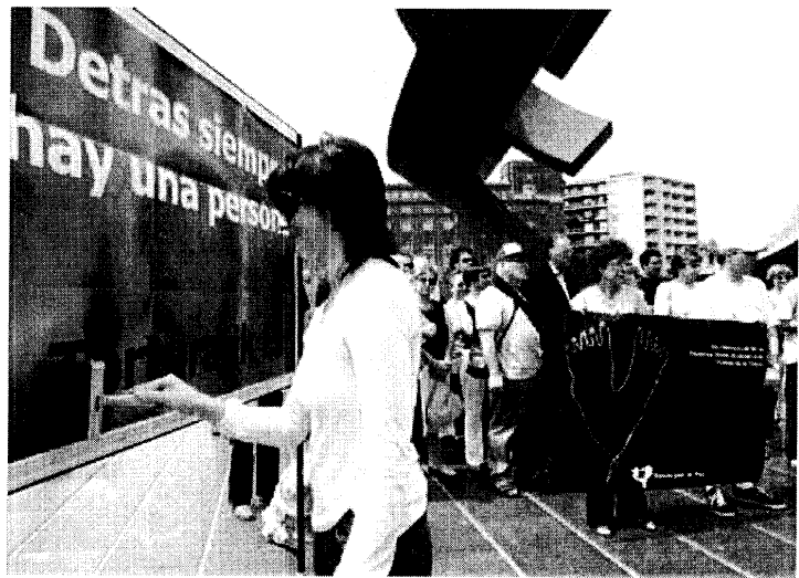
Un momento del acto contra las torturas que celebró ayer en Bilbao Gesto por la Paz.