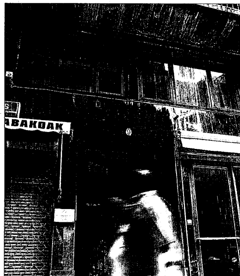
La emisora de Cadena 100 en San Sebastián.

Las reacciones no se hicieron esperar. El presidente del PP de Bizkaia, Antonio Basagoiti, condenó los distintos ataques registrados en la localidad vizcaína de Ondarroa, así como la sede de Cadena 100 en San Sebastián, y lamentó el «preocupante» incremento de la kale borroka, que ha hecho que «los cachorros de ETA vuelvan a tomar las calles». En este sentido, consideró «un error restarle gravedad al terrorismo callejero, lo mismo que es un error el giro de Zapatero en las políticas contra ETA». En un comunicado, criticó que «los actos de violencia callejera» de Ondarroa se produjeran «a plena luz del día» en el centro de la localidad vizcaína «al término de una concentración organizada por Askatasuna, el co-