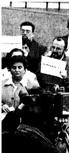
rotestaron ante el hospital.