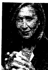
Rosa Díez.

Díez expuso que la orden que dio el Ejecutivo de Zapatero «es legítima», pero como militante socialista desde hace más de treinta años tengo una opinión política crítica con la prisión atenuada para De Juana porque significa que podrá terminar de cumplir su condena en su ca-