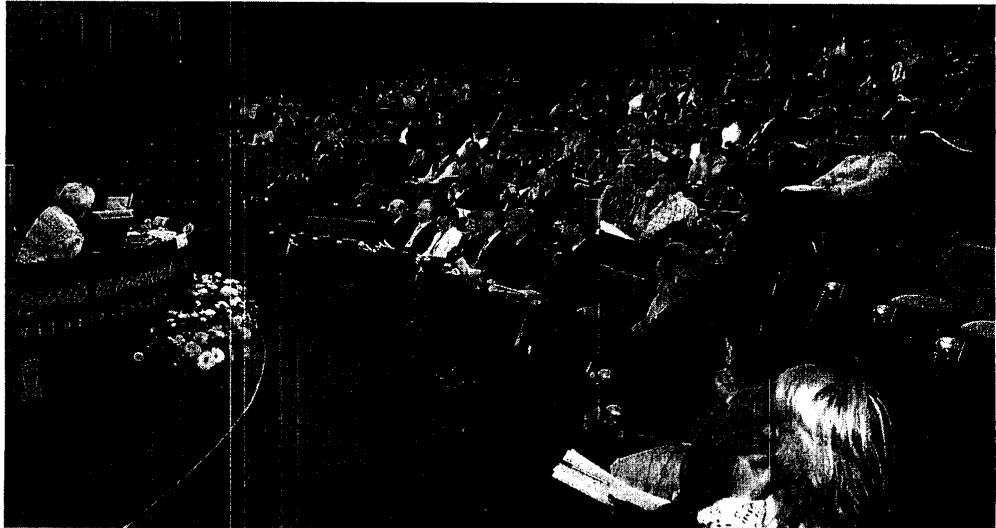
El lehendakari presidió estas jornadas que, sobre el intercambio de buenas prácticas en la educación para la convivencia y la paz, se celebran en Gasteiz.

En esta línea, destaca que «es absolutamente necesario eliminar cualquiera de los espacios de impunidad que en la actualidad siguen funcionando», como «dos periodos largos de incomunicación, la no grabación de los interrogatorios, ni de las distintas dependencias de los centros de detención». Por último, insiste en que es necesario que las autoridades «reafirmen y declaren oficial y públicamente» la prohibición de recurrir a las torturas y a los malos tratos.