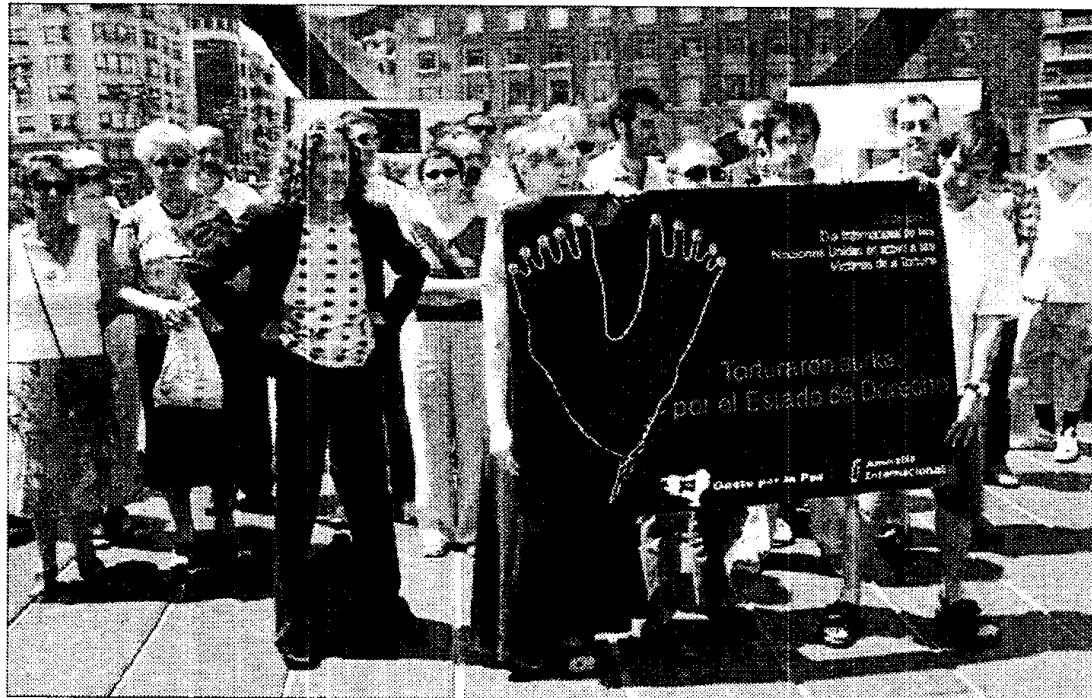
Decenas de personas secundaron en Bilbao la convocatoria de Gesto y Amnistía Internacional.

Por último, Alonso abogó por que la candidatura a lehendakari y la presidencia del partido se unifican en una misma persona, porque "si se da la confianza a una persona para que lidere un proyecto lo tiene que hacer en todos los aspectos, como hemos funcionado siempre en el PP". "Si se ha optado por que lidere el proyecto San Gil, tendrá que liderar el mensaje, el discurso y también el partido", concluyó.