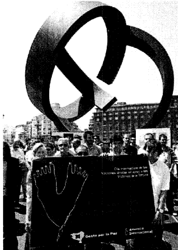
Pancarta de la concentración de Gesto y A.I. en Bilbao.

Durante el acto, miembros de Gesto por la Paz y A.I. dieron lectura a varios extractos de informes realizados por distintas orga-