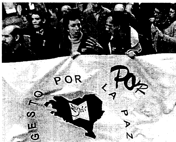
Una de las concentraciones celebradas por Gesto por la Paz.

MEDIDAS Proponen instalar cámaras de vídeo en los interrogatorios y reducir la incomunicación