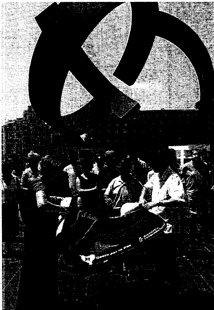
BILBAO. Acto conjunto de Gesto y Ai.