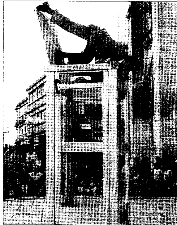
La compañía francesa Le Petit Monsieur actuará en Bilbao el 9 y 10 de julio.

En esta parte del programa destaca el espectáculo Mortibus Orgiac , de la compañía francesa Transe Express, que ya actuó hace dos años en la