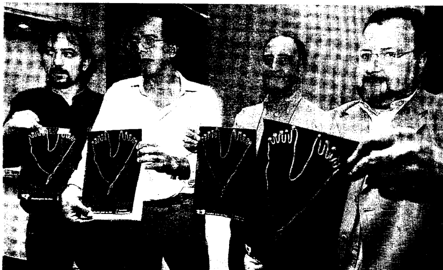
TORTURA. Miembros de Amnistía Internacional y de Gesto por la Paz, ayer en Bilbao.

tivos leyeron ayer un comunicado en el que condenan el último atentado de ETA contra un restaurante en Getxo así como su «inútil y brutal persistencia en su actividad». Al mismo tiempo, AI y Gesto denunciaron la práctica «no sólo en el País Vasco, sino en cualquier parte del Estado español» de lo que calificaron como «una execrable lacra» ante la que «debemos estar alerta». Andrés Krakenberger, de AI, señaló que «la mayor parte de las denuncias de casos de tortura se producen por parte de inmigrantes y en muchos casos con tintes racistas».