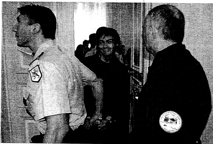
Irribartsu agertu zen donostiar gaztea Paueko Auzitegira eraman zutenean.