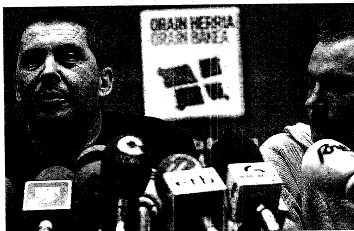
La construcción nacional y la resolución del conflicto serán las prioridades de Batasuna.