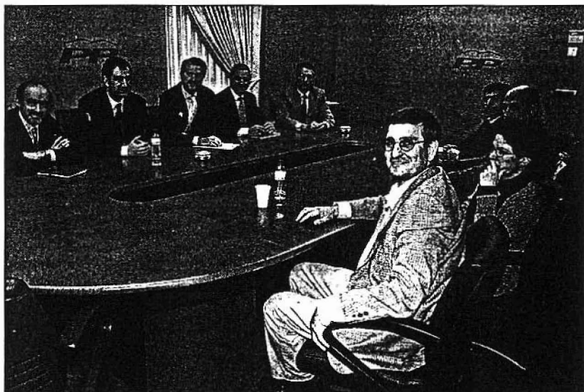
Los dirigentes del PP y UGT en el País Vasco, durante el encuentro que mantuvieron ayer en Bilbao.

Iturzaiz se refería así al documento de ELA en el que el sindicato aboga por iniciar un «proceso soberanista» con una consulta sobre la autodeterminación, aunque lo enmarcó en una estrategia del PNV. «El nacionalismo quiere monetar el follón desde las empresas y los puestos de trabajo para volver a hacer una unidad de acción en defensa de la independencia, la autodeterminación y la secesión», añadió sobre la propuesta de ELA.