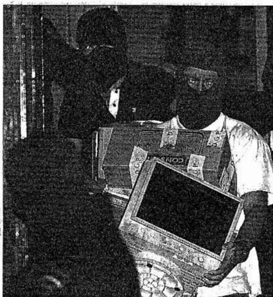
Un policía con el material incautado en la sede de Gestoras de Bilbao.

El portavoz del PNV en el Congreso, Iñaki Anasagasti, afirmó ayer que el juez Baltasar Garzón tenía pruebas «sólidas» y «solvientes» contra los detenidos en la operación que coordinó el propio magistrado, ya que, según recordó, otras operaciones similares de Garzón han terminado con la libertad de los detenidos por falta de pruebas suficientes de su pertenencia a ETA, en alusión al caso Eklin. «Esperamos que las pruebas sean sólidas por parte del juez y si eso evita una trama que sirva de red para ETA, lógicamente nosotros, que estamos contra ETA, tendremos que alegrarnos de la operación», aseguró.