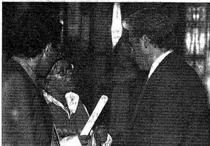
La abogada de Gestoras Arantza Zulueta conversa con Garzón, que dirigió la operación. A la derecha, Jagoba Terrónes durante su detención.