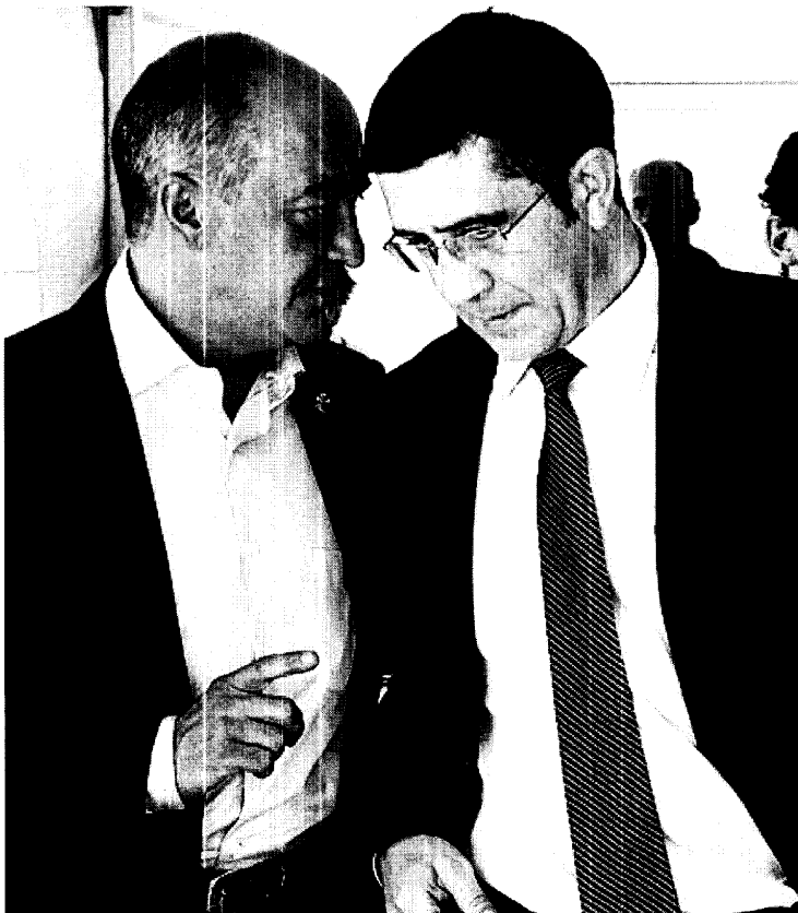
Martín Garitano y Patxi López coincidieron ayer por primera vez en un acto público, la inauguración en Mutriku de una planta de aprovechamiento energético de las olas.

Gesto por la Paz asumió que "es necesario incorporar un reconocimiento a las víctimas y conocer quiénes fueron las personas que sufrieron en su propia piel tales injusticias, y que se haga justicia con la consecuente reparación". En este sentido, los representantes de la asociación destacaron que este reconocimiento no debe ser tomado como un menosprecio a las víctimas del terrorismo, sino que el objetivo es sacar del "ostracismo" a aquellas personas que vieron gravemente vulnerada su integridad física, con delitos que ocurrieron al final de la época franquista y durante la transición. Delitos que no fueron aclarados en su momento, según denunciaron desde el colectivo. "Se debe