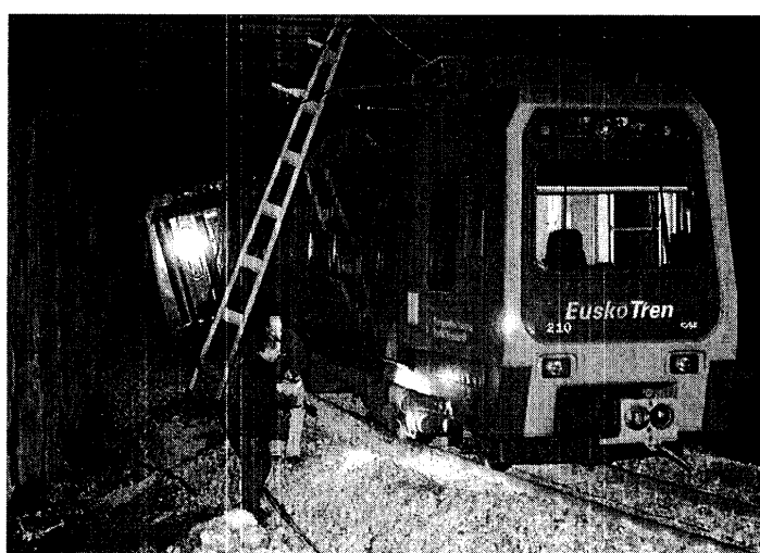
Dos técnicos inspeccionan las unidades del tren descarrilado en Durango hace un mes.

La Policía Local de Barakaldo inició ayer una huelga de celo para reclamar al equipo de gobierno (PSE y PP), un aumento de la plantilla, que en estos momentos está formada por 114 agentes, y una modificación de los complementos específicos.— EFE