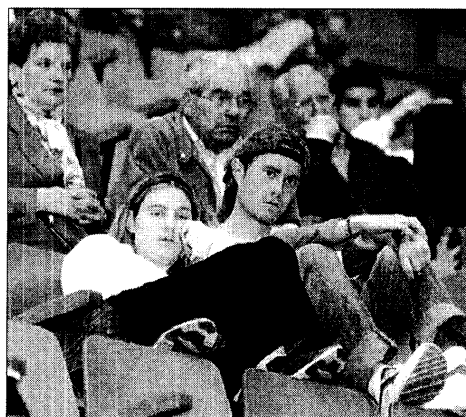
Último sorteo de pisos en el frontón Ogueta de Vitoria.

Creo que ganaríamos como sociedad si más a menudo "comunidad autónoma" se viera como conjunto de ciudadanos autónomos. O si se midiera la autonomía de una comunidad no tanto por las competencias que asume el poder o el gobierno como por el grado de autonomía de cada una de las personas que la integran. Autonomía en el sentido material e intelectual; de libertad física y de la otra, la que se concreta en grados de información, cultura, capacidad de respuesta crítica. O si el desarrollo estatutario se identificara con la responsabilidad política de garantizar niveles cada vez más altos de independencia individual.