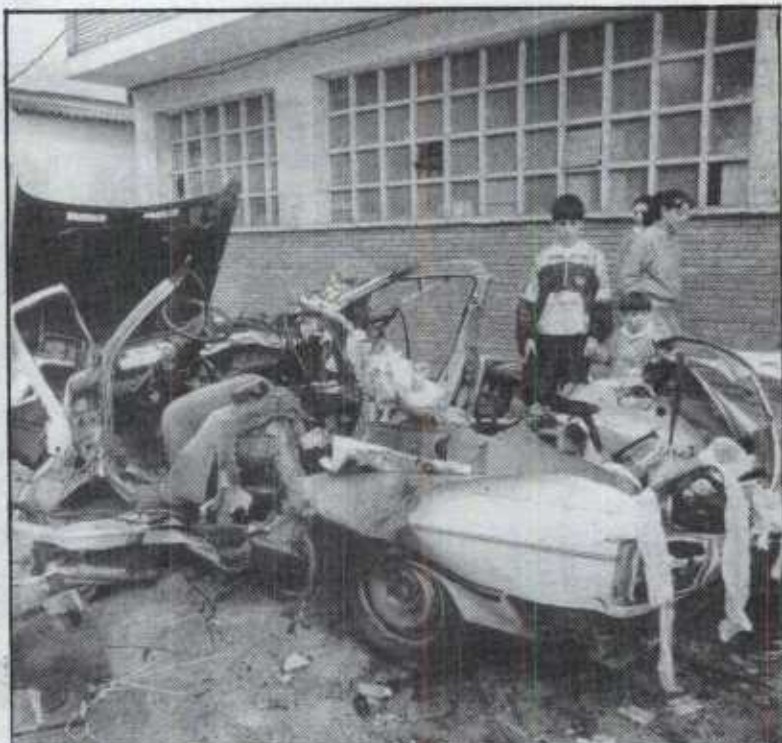
Estado en que quedó el taxi robado por el comando poco antes del atentado.

fueron activados mediante temporizadores a partir de las doce menos cuarto de la noche. Los disparos fueron programados con varios minutos de diferencia y, como soporte de las granadas, los etarras utilizaron tubos de cartón endurecido.