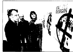
Responsables de Gesto, ayer.

Respecto a ETA, Ríos expresó su deseo de que ponga fin a la violencia «cuanto antes» y que «todo empiece por un primer comunicado en el que se acepte el llamamiento de