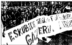
Manifestación de Segi ayer en Donostia.

El líder jeltzale se defendió además de las críticas recibidas por su viaje a Bruselas para recabar el apoyo de la Unión Europea con el fin de lograr la paz. La Unión Europea lo ha hecho con Irlanda del Norte. Y también podría hacerlo con Euskadi. De otra manera pero podría hacerlo. ¿Acaso no es bueno para Euskadi que recibamos apoyo y ayuda? Pues parece que los socialistas vascos creen que no. Y los socialistas vascos critican el viaje. Como el perro del hortelano. Ni hacer ni dejar hacer», recriminó Urkullu.