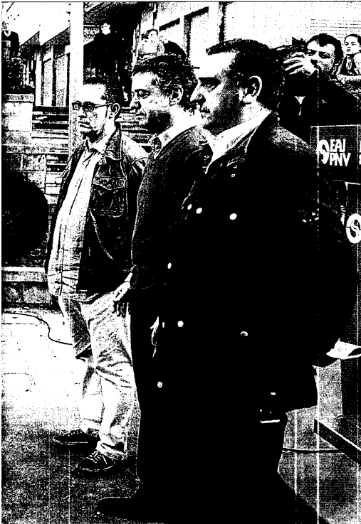
Iñigo Urkullu y Ana Madariaga, entre otros nacionalistas, durante el acto político organizado ayer en Repelega (Portugalete).

esas buenas palabras no se escucharan cuando dirigentes nacionalistas se reunieron con miembros de la izquierda abertzale.