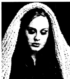
La cantante británica Adele.