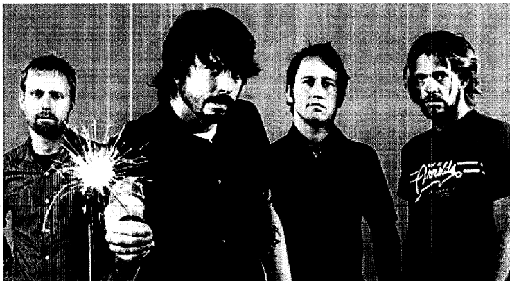
El grupo Foo Fighters es uno de los favoritos a llevarse alguno de los preciados galardones.

RAP FAVORITO El rapero Kayne West parte como favorito de estos premios, considerados los Oscar de la música, con siete candidaturas, aunque pocas de ellas se sitúan entre las más importantes, a excepción de la de mejor letra del año, por All of the lights . Tanto la británica Adele como Bruno Mars y Foo Fighters cuentan con media docena de candidaturas, situadas entre las más importantes. En el caso de Adele, su