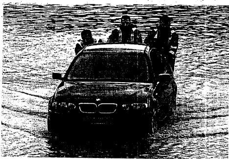
INUNDACIONES. Balsas de agua en la A-8.

Mientras tanto, el objetivo de la mesa de seguimiento es continuar desembalsando para que Ullibarri recupere su cota normal. No obstante, el organismo no bajará la guardia por si las previsiones meteorológicas cambiaran y hubiera que improvisar nuevas medidas.