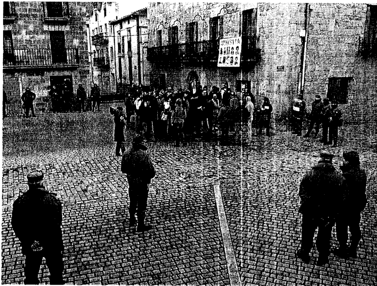
Prensaurrekoa hasi baino ordu erdi lehenago Guardia Zibilak erabat hartuta zeukan Altsasu herria.