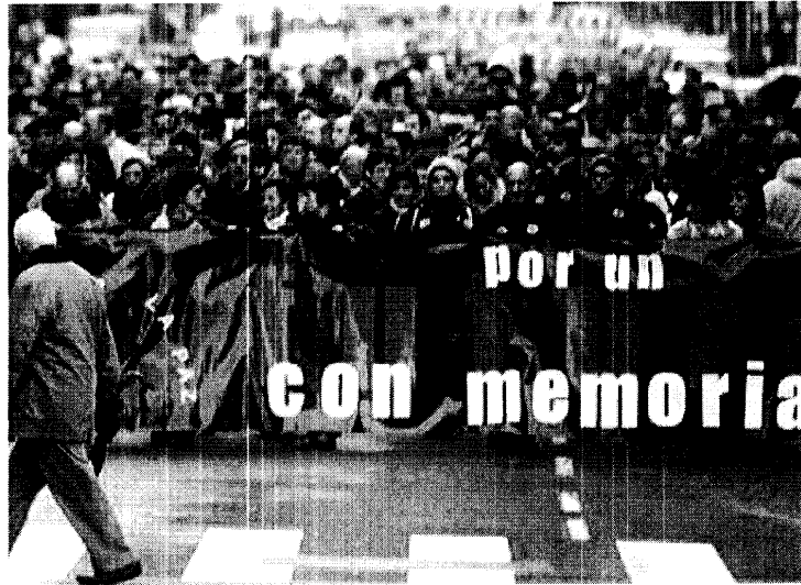
Manifestación de Gesto por la Paz celebrada ayer en Bilbao.

El foro, que reunió ayer en Olite a un centenar de cargos públicos del partido navarro encabezados por su presidente, Miguel Sanz, recordó asimismo a las instituciones su papel de servicio a los ciudadanos y, en este sentido, los asistentes subrayaron que «Navarra siempre ha ido a negociar con el Estado aportando soluciones y no creando problemas». ■ EFE