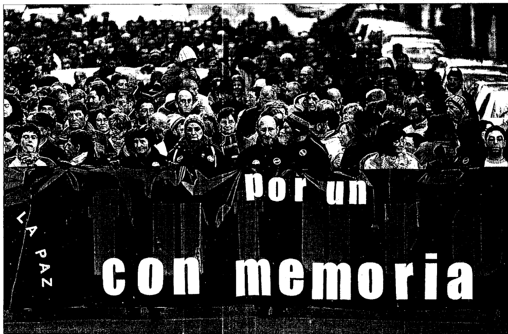
Representantes de Gesto por la Paz encabezan la manifestación que ayer recorrió las calles de Bilbao.