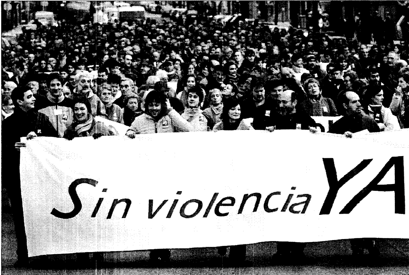
Los participantes de la manifestación de Gesto, ayer, por la Gran Vía de Bilbao.