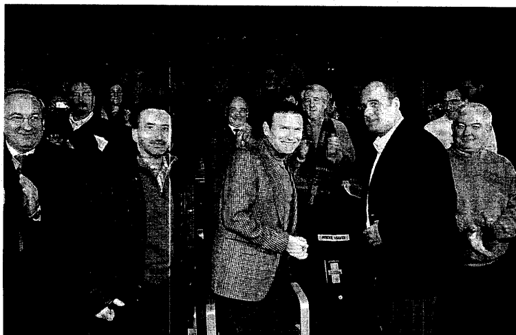
Juan Jose Ibarretxe EAJko buruzagiekin eta kargu publikoekin batera izan zen Andoaingo ekitaldian.

Salaketak salaketa, astearte-an Madrilera joateko prestutasun osoa agertu zuen lehenda-