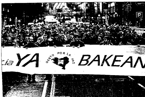
La cabeza de la manifestación recorre la Gran Vía.