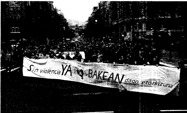
Un momento de la manifestación convocada por Gesto en el aniversario de la muerte de Gandhi. J.M. Martínez