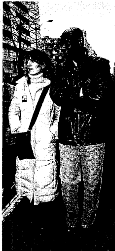
RESPALDO. El director de Inmigración del Gobierno vasco.

se dirigieron a ETA, la «responsable de la mayor conculcación de derechos humanos que se continúa realizando en Euskal Herria». La coordinadora exigió a la banda terrorista que «nos deje vivir en paz» porque «queremos ejercer plenamente nuestra libertad» y porque «el futuro sólo puede ser en paz».