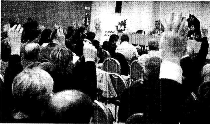
Momento de la votación en la asamblea regional de EA, ayer en un hotel de San Sebastián.

Reivindica la validez de las firmas que piden un congreso extraordinario La mayoría de compromisarios del sector oficial no participó en la reunión