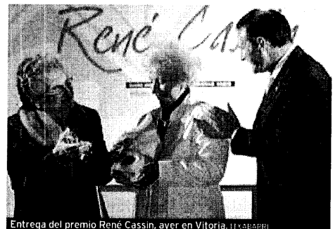
Entrega del premio René Cassin, ayer en Vitoria.