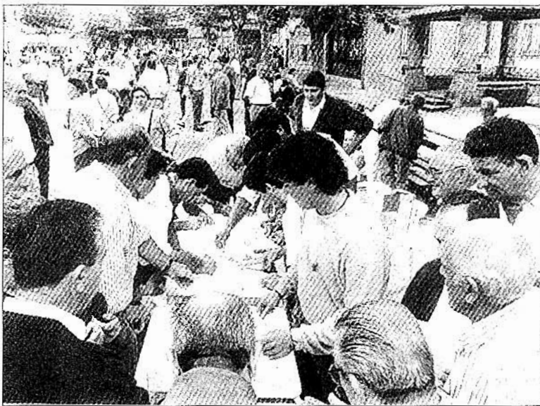
Mendavia respondió de forma espectacular a la convocatoria de Gesto por la Paz.

La acogida por parte de los mendavieses a esta iniciativa es merecedora de encomio. La petición para firmar o recibir el lazo fue masiva, de forma