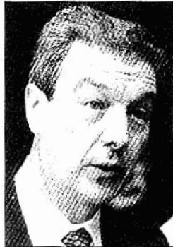
Pedro Ruiz de Alegría.

ponsable de las fuerzas de seguridad del Estado en Navarra, "la construcción de un nuevo cuartel es una necesidad del cuerpo y obedece a los planes de redistribución de fuerzas ya en marcha también en Navarra, en la que han desaparecido otros cuarteles como el de Etxarri Aranzatz. Por ello, le guste o no le guste al señor alcalde de Lekunberri o a otras personas, y reiterando mi máximo respeto hacia ellos y hacia sus opiniones", continuó Ruiz de Alegría, "el proceso para la construcción del cuartel sigue