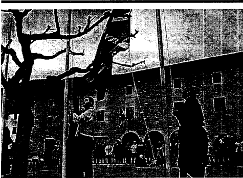
Dantzaris de Etxauri izan la ikurriña en representación de los vecinos. S.L.