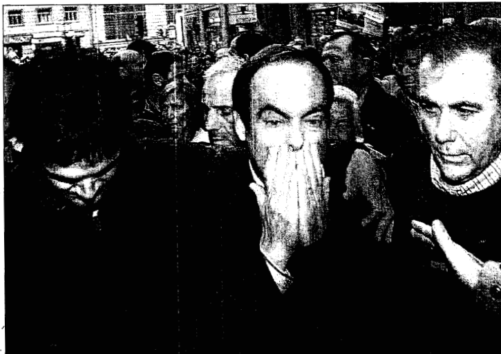
Bono, seguido por Rosa Díez (detrás, en segundo plano) y abrazado por su hijo, tras ser insultado en la manifestación.

A falta de un cántico claro desde un principio, grupos de asistentes, se dedicaron a corear consignas que poco tenían que ver con el espíritu de la convocatoria y mucho con otro tipo de cuitas que en nada favorecen a la unidad contra el terrorismo. Lo más escuchado fueron frases como las de «Zapatero dónde estás», «Peces Barba dónde estás», en reproche claro por la ausencia del presidente del Gobierno y del Alto Comisionado de Apoyo a las Víctimas. Pero a estos se unieron otro tipo de cánticos en los que se mezclaban las quejas por la unidad nacional o la solicitud del voto contrario a la Constitución europea como forma