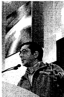
Patxi López, ayer en Gasteiz.

«Siempre hemos respetado la voluntad y las decisiones de la ciudadanía vasca», aseveró en su intervención en unas jornadas de las Juventudes Socialistas en Gasteiz.