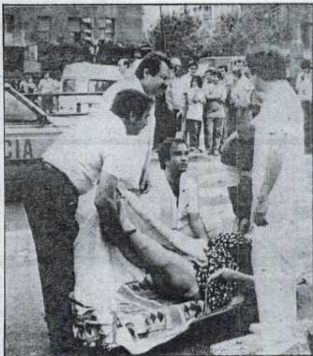
Personal sanitario y voluntarios sacan a una mujer herida del centro comercial Hipercor, cuyo interior puede verse en la fotografía de la derecha, completamente devastado por la explosión.

De segunda categoría (cinco números más el complementario) han aparecido 10 acertantes, que cobrarán, cada uno, 13.264.523 pesetas. Los acertantes de tercera categoría (cinco números) cobrarán 343.222 pesetas; los de cuarta (cuatro números) tiene un premio de 6.644 pesetas y los de quinta (tres acertados) recibirán 508 pesetas.